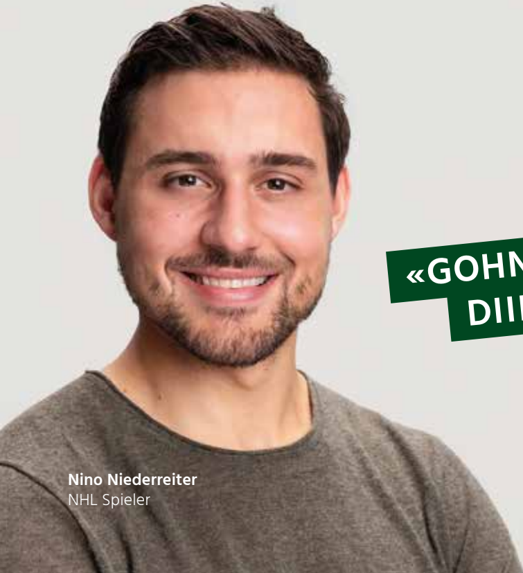
Nino Niederreiter NHL Spieler