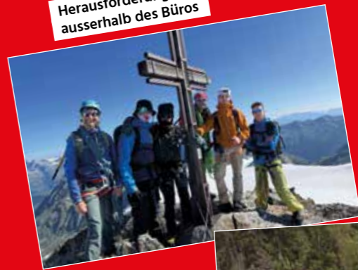
Bergtour Bergtour auf den Piz Medel – auf über 3'209 m ü. M.